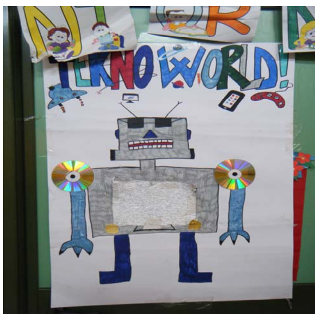
FOTO RICORDO DEI ROBOTINI