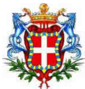
Città di Moncalieri