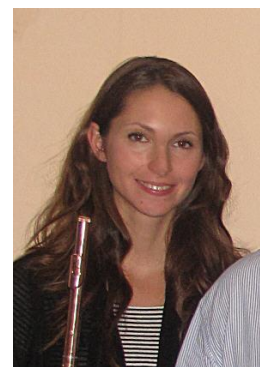
ALEXANDRA ZABALA soprano