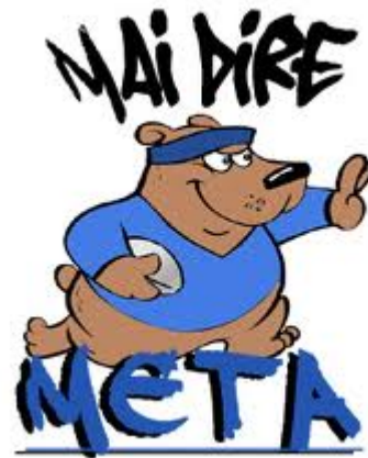
azione del trequarti