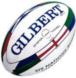
pallone da rugby