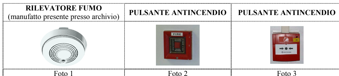
Foto 3: premendo con una semplice pressione del dito sul tondo nero indicato dalle due frecce vengono attivate le sirene di allarme antincendio e le misure di sfollamento dell'edificio.

Foto 2: rompendo il vetrino vengono attivate le sirene di allarme antincendio e le misure di sfollamento dell'edificio.