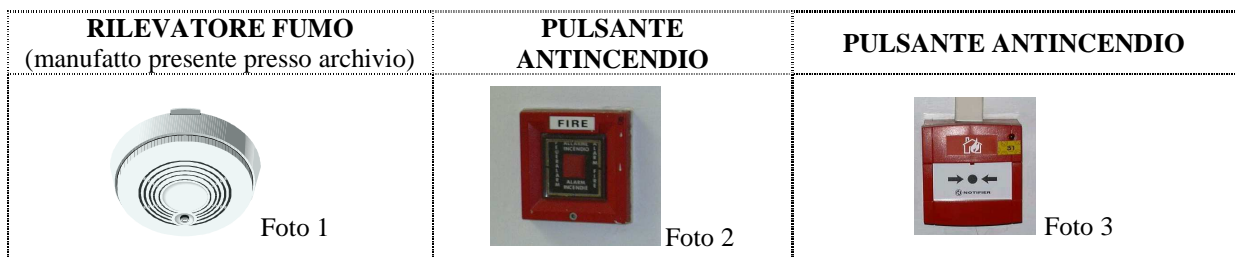
Foto 3: premendo con una semplice pressione del dito sul tondo nero indicato dalle due frecce vengono attivate le sirene di allarme antincendio e le misure di sfollamento dell'edificio.

Foto 2: rompendo il vetrino vengono attivate le sirene di allarme antincendio e le misure di sfollamento dell'edificio.