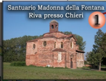
Santuario Madonna della Fontana Riva presso Chieri