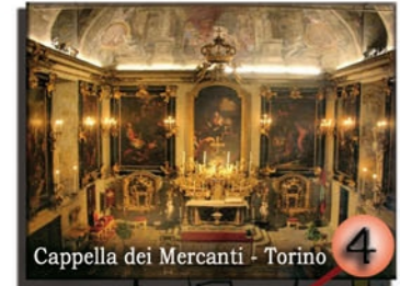
Cappella dei Mercanti - Torino