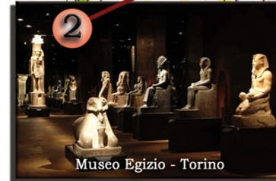
Museo Egizio - Torino