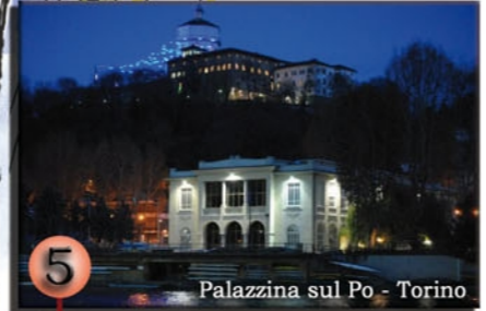
Palazzina sul Po - Torino