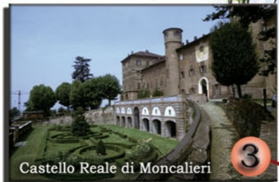
Castello Reale di Moncalieri