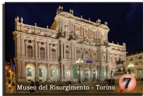
Museo del Risorgimento - Torino