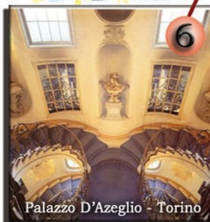
Palazzo D'Azeglio - Torino